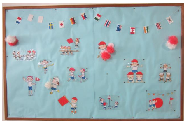
↑ 職員昇降口にある運動会ボードです