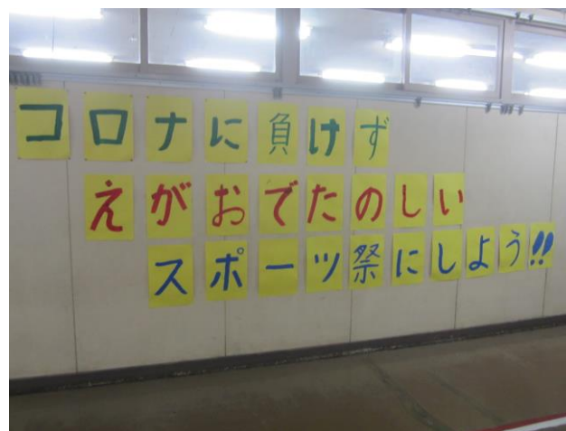
↑ 職員室廊下に掲げられています。