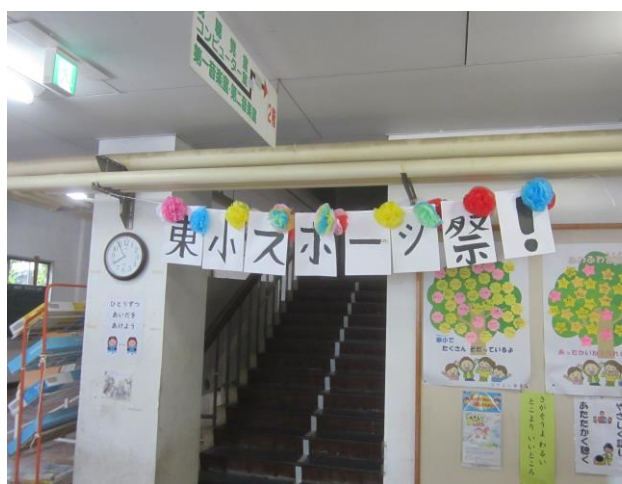
↑ 毎朝、子どもたちを迎えてくれます