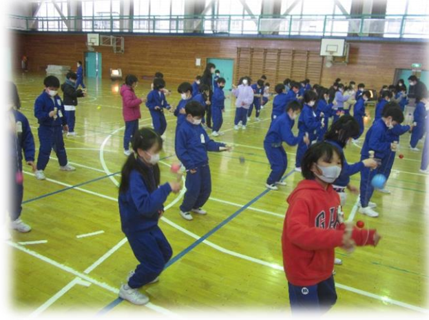
(写真) 上の左右：1年生のこま回し体験 下の左右：2年生のけん玉体験