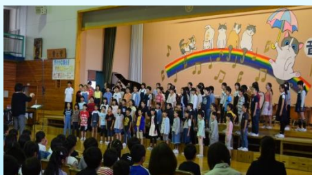
4年生「未知という名の船にのり」 高学年らしいのびある素敵な歌声でした。クラスごとの合奏もそれぞれの良さが出て素敵でした。