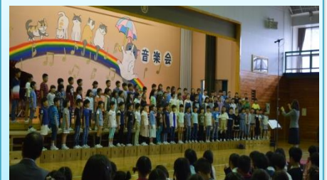
3年生「はじめまして素敵な友達」 「笛星人がやってきた」 高音を意識して練習しました。リコーダーも安定して素敵でした。