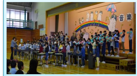
6年生「英雄の証」 「わたしが呼吸するとき」 圧巻の演奏でした。見ているものみんなが引き込まれる素敵なステージになりました。