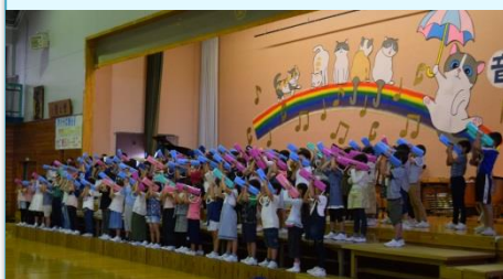
2年生「ひんがし2年鍵ハモ隊」 「せかいじゅうかいじゅう」 学年が一つになり素敵な音、迫力のある音を響かせました。