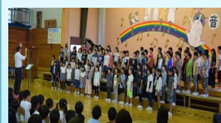
5年生「少年の日は いま」 高音の響きがとても素敵な歌声で表現できました。学級の合奏はクラスの個性を発揮し、素敵でした。