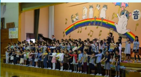
1年生「元気な1年生の1日」 学校の1日呼びかけ、歌と合奏で元気に表現してくれました。はじめての音楽会楽しみました

今年の東小学校の音楽会は、学年・学級の個性が十分に発揮できたものになったと思います。バラエティーに富んだ素敵な音楽会でした。会場の雰囲気も素敵でした。最後の最後まであたたかく見つめていただき、拍手を送って下さったお家の方々に心より感謝いたします。本当にありがとうございました。今後ともご支援とご協力をお願いいたします。