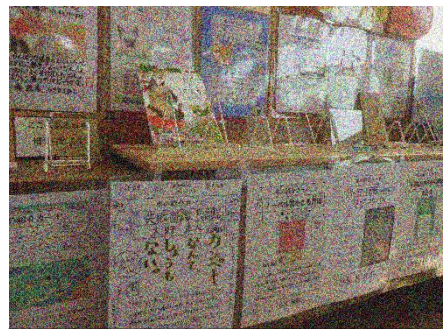
おすすめ本の展示

を行うことで、本に触れる時間を作ってきました。お家でも、本と親しむ時間が増えましたか。読書旬間は終わりましたが、これからも本の世界を楽しんでほしいと思います。