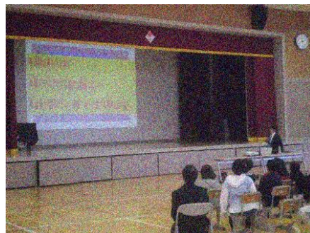
人権講演会の様子

また、学年の段階に応じて、授業やその他学校生活のいろいろな場面で、人権にかかわることについて学びました。お互いを認め合い、やさしい気持ちがあふれる学校づくりをこれからも進めていきたいです。