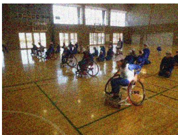
車いすリレーの様子

お忙しい中、ご来校いただきありがとうございました。授業で扱っていた内容について、ご家庭でも話題に出していただけると、子どもたちの人権感覚がより磨かれていくと思いますので、よろしくお願いいたします。