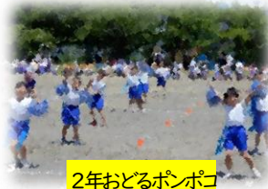
2年おどるポンポコ