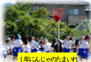
1年になんじゃのたまいれ