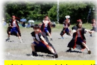
4年どっこいしょー!!!ソーラン節