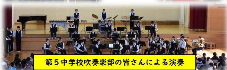
第5中学校吹奏楽部の皆さんによる演奏