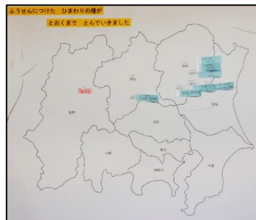
図1 メッセージ到着のお知らせを戴いた所にフセンを付けています。

風船に付けたメッセージが長野県を越えて飛んでいきました。栃木県や群馬県のような所から届いたことを知らせるお電話やお手紙が寄せられています。校長室前廊下の壁に、白地図を掲示して、現在、連絡をいただいた所を記しています(図1)。また、宇都宮市にある農業公社様からお手紙の他に、ステッカーと路面電車のペーパークラフトも贈っていただきました。今後、このご縁を大切にしたいと思っています。