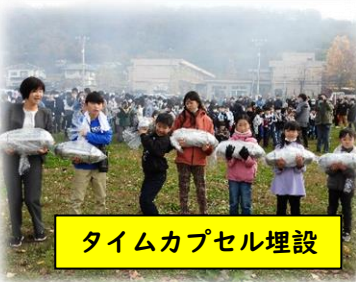
タイムカプセル埋設