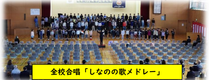
全校合唱「しなのの歌メドレー」