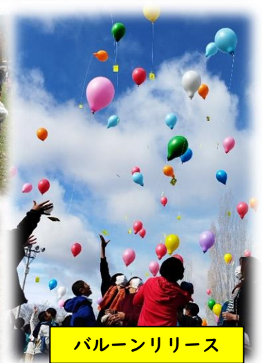
バルーンリリース