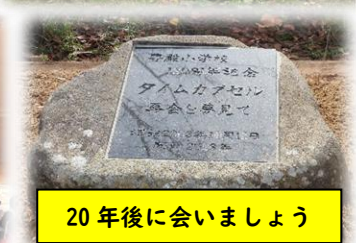
20年後に会いましょう

1年1組 (天気) はれていて、バルーンがきれいでした。やきいももおいしかったです。