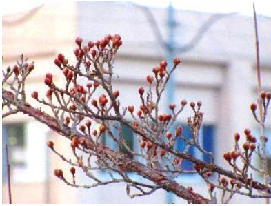
いこいの広場のサンシュユのつぼみ

2021年も早いもので一ヶ月が過ぎ、2月ももう中旬。寒さはまだまだ続きそうですが、日は確実に長くなり、日中の日差しもだんだん「濃さ」を増しています。もうすぐ「春」です。これまで何回も迎えてきた「春」ですが、何回迎えても「春」がやってくることはやはり嬉しいものです。日常は、新型コロナウイルスに支配されてしまっていますが、季節はいつも通りに巡ってくれていること、本当に感謝したい気持ちです。