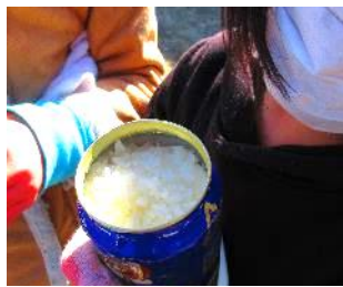
お米を洗って → 缶を二段にして炊いて → 炊きあがり!

3年生は、棚田で作ったお米で、空き缶を使って一人分を炊飯する「サバイバル炊き」に挑戦しました。火がつかなかったり、水やお米をこぼしてしまったりと、午前中3時間の取り組みは、失敗の連続……。しかし、失敗も経験の一つとして受け入れて先に進もうとする3年生、たくましいです!