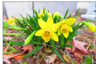
中庭のスイセンが咲きました！

令和2年度の学校生活も終わりを迎えました。校長講話にもありますが、2ヶ月間休業だったこともあり、例年以上に短く感じた1年間だったように感じます。短く感じた1年間でしたが、「感動」や「笑顔」はいつもと同じか、それ以上にたくさんあった豊殿小学校でした。豊殿小学校の様子をお伝えしてきた「えぼし」は、本号が本年度最終号です。これまで、豊殿小学校の教育活動を支えていただいた皆さん、本当にありがとうございました。来年度もどうかよろしく願いいたします。