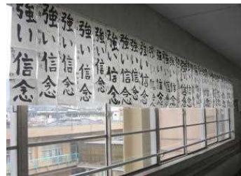
全校の書初作品勢揃いです！