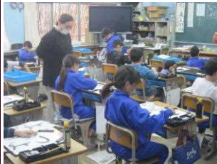
3.4年生は書初ボランティアの方と練習しました！

1月14日(火)から校内書き初め展が行われており、どの学年の廊下にも、書き初め作品が飾られています。1.2年生は硬筆、3~6年生は毛筆で書かれた作品です。3.4年生は12月に書き初め学習のボランティアとして、地域の方にご指導をいただきました。どの学年の作品からも心を落ち着かせ、新たな年への意欲をもって取り組んだことが伝わってきます。また、冬休みに取り組んだ図画工作の作品が飾られている学年もあります。ほのぼのとした気持ちになります。学校は、たくさんの子どもの作品が展示され、エネルギーに満ちた雰囲気になっています。