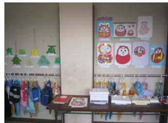
お正月らしい作品がずらり！