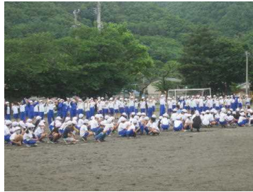
各学年からのメッセージ

感染防止のため、会場を体育館から校庭に移し、全校で1年生を迎えました。それぞれの学年から1年生へ温かいメッセージが送られ、1年生はとても嬉しそうな、少し照れたような表情を見せていました。神川小学校は全校が一つのチームです。学年の枠をはずして、心を通わせていきたいと思っています。