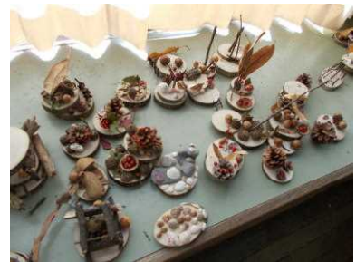
4年：自然の材料を使って