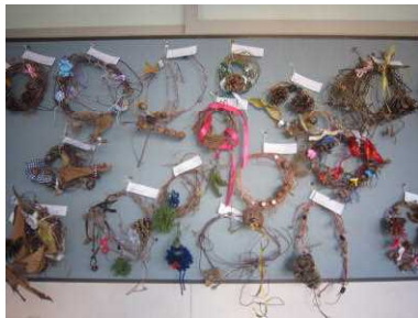
1年：あさがおのリース

廊下を歩いていると、様々な作品が飾られています。どの作品も、子どもたちが思いや願いを込めてつくった、世界でたった一つの大切な作品です。材料に触れながら、イメージを広げて完成させました。