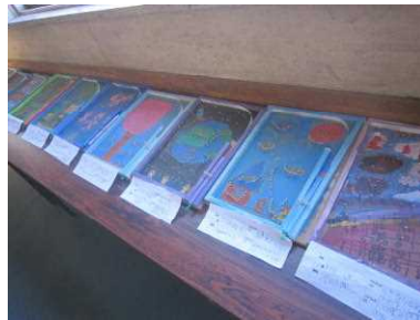
3年：玉ころがしゲーム