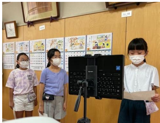
始業式での発表 (5年生)

このように元気に集まれたことがうれしいです。当たり前のことができるのがすごいです。さて、ここで問題です。2学期は何日あるでしょう。85日間です。2学期は1年で1番長い学期です。季節も夏・秋・冬と3つ。長くて大変だけれども、立てた目当てに何度も挑戦できる学期です。悔いのない毎日を過ごし、2学期を充実させてほしいです。ここで1冊本を紹介します。