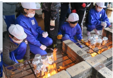
ご飯も上手に炊けました