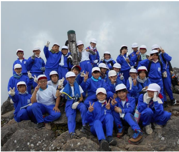
5年生 クラスごと山頂での一枚

今現在は感染レベル3となり、少しずつ落ち着いてきていますが、感染予防対策をとりながら、今後も工夫をし、行事を進めていきたいと思います。