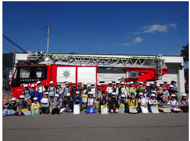
3年生 市内見学 消防署にて