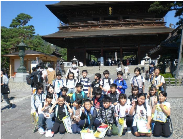
4年生 長野市見学 善光寺にて