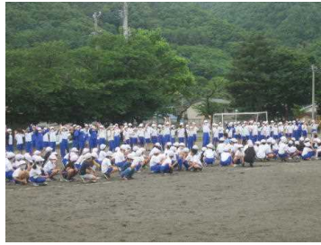
各学年からのメッセージ

感染防止のため、会場を体育館から校庭に移し、全校で1年生を迎えました。それぞれの学年から1年生へ温かいメッセージが送られ、1年生はとても嬉しそうな、少し照れたような表情を見せていました。神川小学校は全校が一つのチームです。学年の枠をはずして、心を通わせていきたいと思っています。