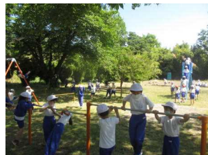
2年生 黒坪公園お散歩