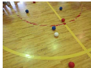
6年生 ポッチャ対決