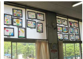
4年ステンドグラス風です