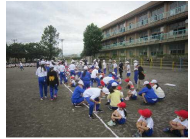
1年生へメダルのプレゼント