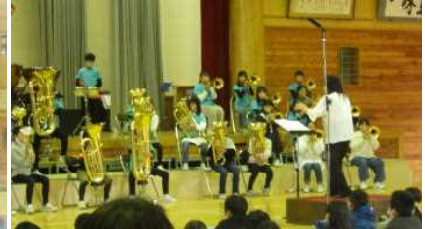
金管バンドクラブ