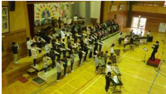
6年合奏「ドラゴンクエスト ロトのテーマ」

五年 稲刈り 稲穂が美しい黄色に実りました。地域の方のご指導のもと稲刈りを行いました。初めの体験に感動と達成感を覚えた一日でした。