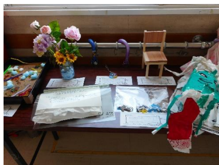
夏休みの作品展示