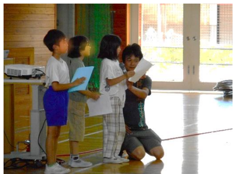
1 学期終業式児童作文発表

それでは、1年で一番長い2学期は、1年で一番成長できる学期です。先生たちは、がんばるみんなを力いっぱい応援します。なので、はりきって、楽しんでいきましょう。