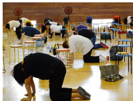
学校保健委員会での体操場面