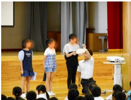
2 学期始業式 児童作文発表