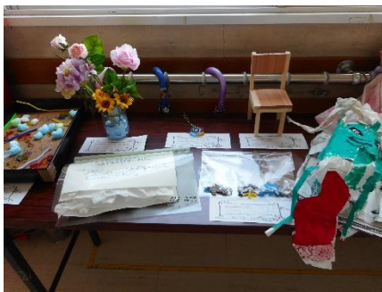
夏休みの作品展示