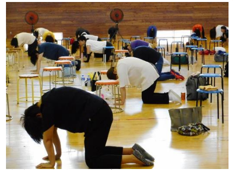
学校保健委員会での体操場面