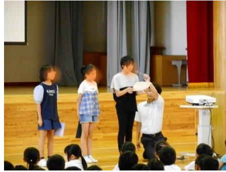
2 学期始業式 児童作文発表