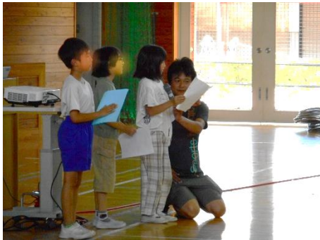
1 学期終業式児童作文発表

それでは、1年で一番長い2学期は、1年で一番成長できる学期です。先生たちは、がんばるみんなを力いっぱい応援します。なので、はりきって、楽しんでいきましょう。