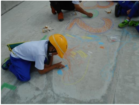
3年生 バイパス工事見学