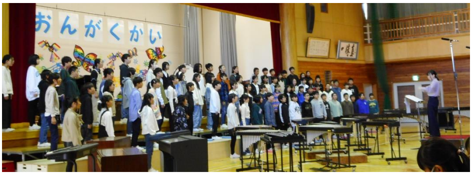
6年生 最後の音楽会