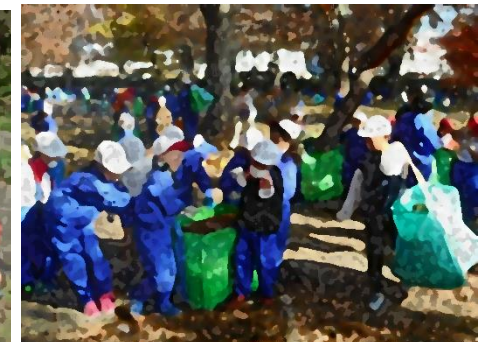
全校 史跡公園清掃