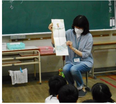
ボランティアによる読み聞かせ