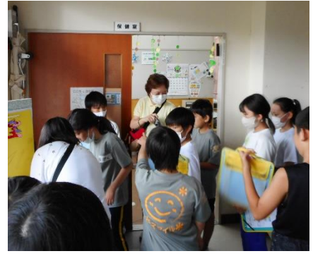
上田養護学校との交流