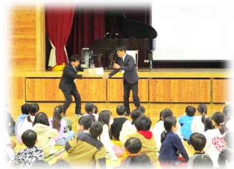
「校長先生、こんな荷物が届きました」 教頭先生の熱演

そんなことが話題になっていたさなかですので無理もありません。みんなもっと近くで見たいと言うので、今日は忙しい日課でしたが、各クラスで少しずつ3つのグローブを見たり、触ったりしてもらいました。休み明けには、実際にキャッチボールを