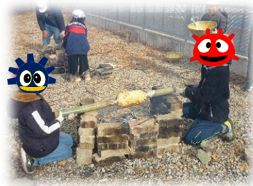
2・5年生のバウムクーヘンづくり