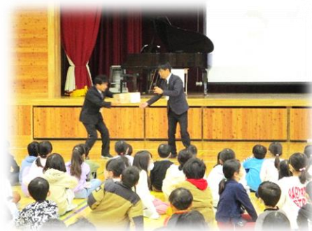
「校長先生、こんな荷物が届きました」 教頭先生の熱演

そんなことが話題になっていたさなかですので無理もありません。みんなもっと近くで見たいと言うので、今日は忙しい日課でしたが、各クラスで少しずつ3つのグローブを見たり、触ったりしてもらいました。休み明けには、実際にキャッチボールを