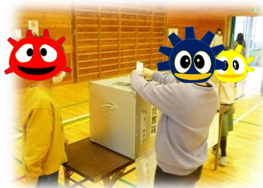
児童会選挙の投票