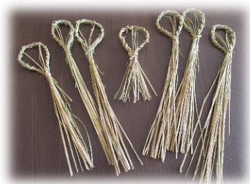
4年生が作ったしめ飾り