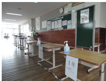
昇降口で、消毒・検温を。Withコロナですが、慣れすぎないように