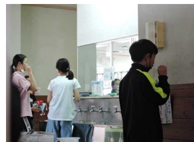
歯磨きの仕方にも配慮して思いやる気持ちをもって