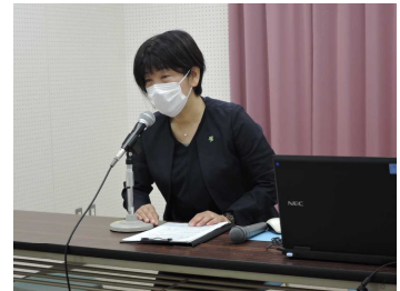
放送室から全校にメッセージ

2学期は、運動会、音楽発表会などの行事もあります。いろんな体験ができそうですね。また、毎日の授業や学校生活でたくさん考えてください。今もすてきな川西小学校ですが、さらに、よい学校にするために学校生活にするために、考え、行動する2学期にしましょう。（始業式のお話より）