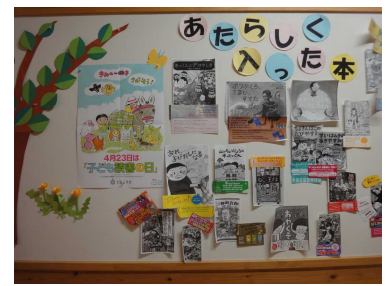
新刊も借りられます