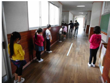
手洗いの並び方指導