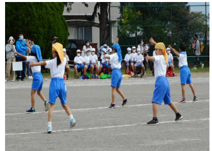
2年表現「元気いっぱい2年生」