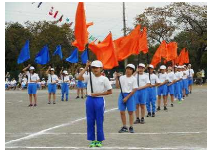
5・6年表現「千本桜 川西ver」