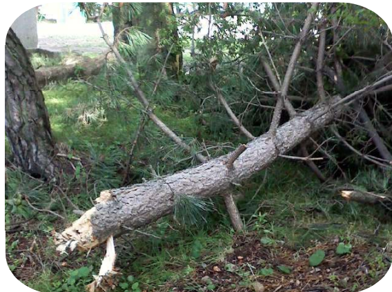
南門の松 上部直径20cm以上の幹が折れる 風の関係で校庭側に落下 南に落下した場合民家直撃の可能性があった