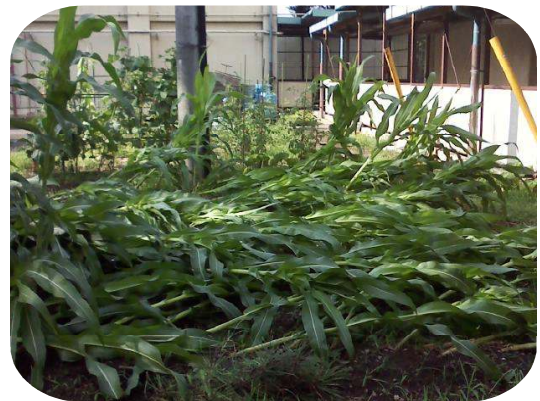
2年生のトウモロコシが倒れる