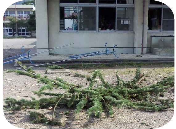
保健室前にはヒマラヤスギの大枝が落下 保健室まで数メートル 物干しも完全にたおれ竿がちょっと曲がる