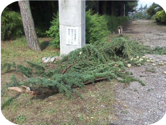
東門に落下していたヒマラヤスギの大枝 でかい松ぼっくりが保健室の前まで たくさん落ちていました。