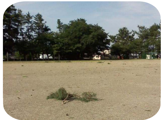
校庭に散乱する小枝と松ぼっくり