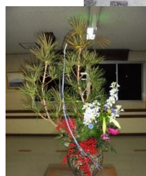
現在の作品（お正月 version）