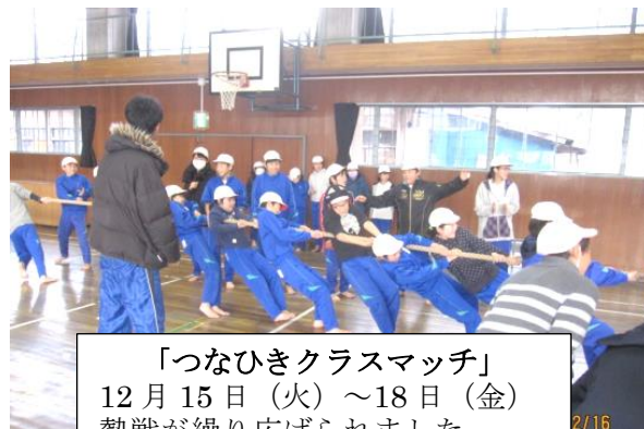
「つなひきクラスマッチ」 12月15日(火)～18日(金) 熱戦が繰り広げられました。

「子どもたちの提案による学年学級をこえた遊びの輪」の広がりを期待していきたいと思います。