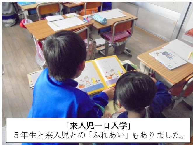
「来入児一日入学」 5年生と来入児との「ふれあい」もありました。

外部講師によるクラブ活動は9月に終了しましたが、児童から「(今年は全8回でしたが)もっとクラブ活動を続けたい」といった声が聞かれました。また、5・6年生で行った職場体験学習では、体験を通し、仕事(職業)や、仕事をしている地域の方への思いを膨らめていく児童の姿が数多く見られました。更に、学習支援ボランティアの方とのふれあい、北小祭り、学校りんご園でのりんご栽培を通したふれあい等、「多様な大人と直に相互に関わる」機会を得て、子どもたちの中に人に対する関心や愛着、信頼感が育っていると感じられる場面が多数見られました。校内でも異学年交流によるふれあいの機会が多くもたれ、相手意識が豊かに育っている姿が多く見られました。