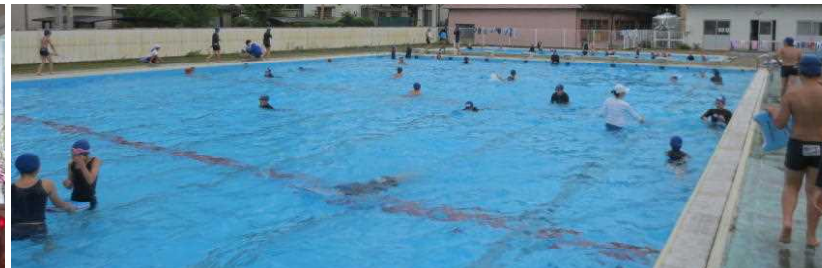
プール学習の様子