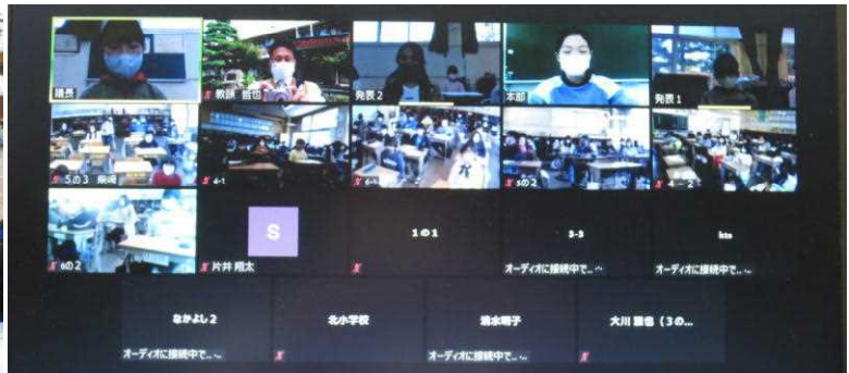
4/26 「オンライン児童総会」