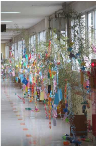
七夕祭りさながらの 1年生廊下