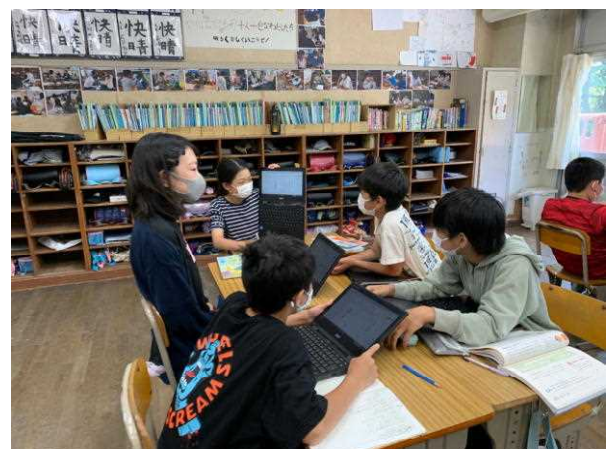
一人1台端末の導入(6年生の様子)

「1年生を迎える会」今年は計画どおり5月に行うことができました。一人1台端末を使った授業も始めました。6年生から使用を始め、職員も活用方法を研修し、全学年が活用をしています。