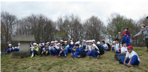
4/28 「遠足(2~4年生)」写真は4年生、太郎山の頂上です

今年は、部活動を4月から活動を始めることができました。昨年できなかった遠足も、無事行うことができました。