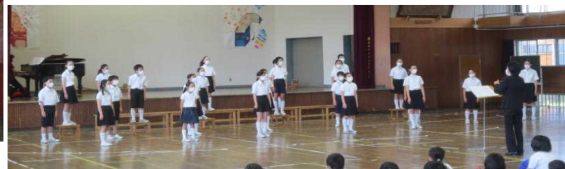
7 / 14, 15 「合唱部壮行会」

1年生、前庭東に茂る笹竹をとってきて、願いを書いた短冊を飾りました。 合唱部の歌声は、マスク着用・2mの間隔という厳しい条件のなかでも、全くゆるぎない美しい響きのハーモニーでした。7 / 29のNHKコンクールでは、サントミュージゼのホールいっばいに北小のハーモニーを響かせてきてください！