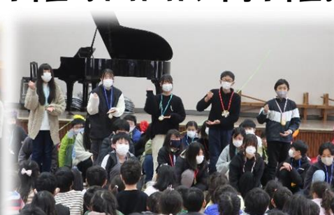
6年生 コントと群読「生きる」