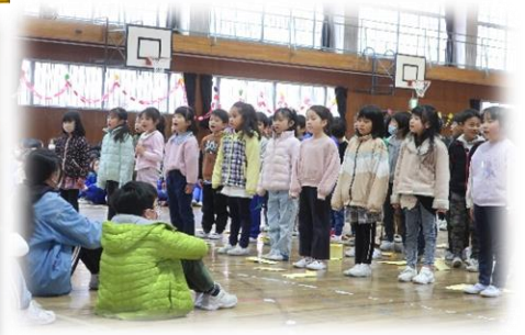
1年生 ♪ドキドキドン中学1年生♪