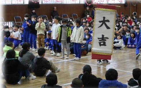
2年生 おみくじとハッピーダンス