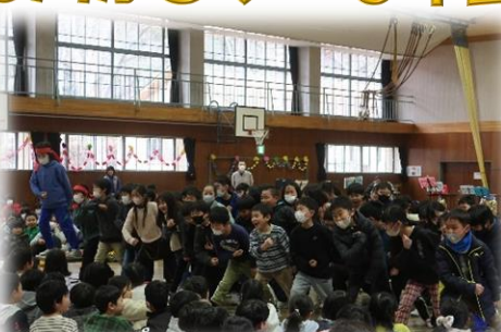
3年生 応援のエール「パワー！」