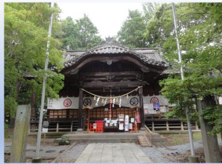
おおほしじんじゃ 大星神社

その前(江戸時代まで)には、今で言う学校というものはなく、 神社やお寺・有力者が中心となり、寺子屋・藩校などで学んでいた。 学ぶことができない子どもも、たくさんいた。