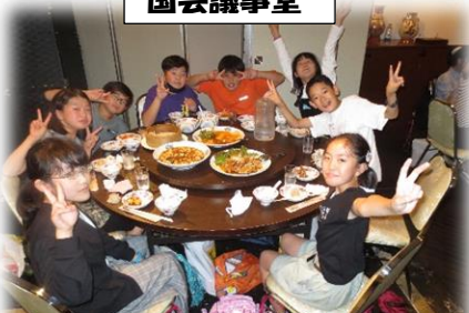
中華街で豪華中華料理！