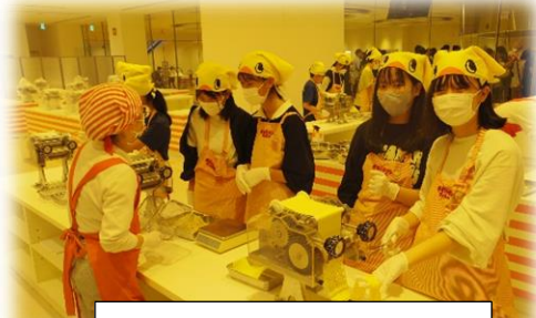
チキンラーメンファクトリー