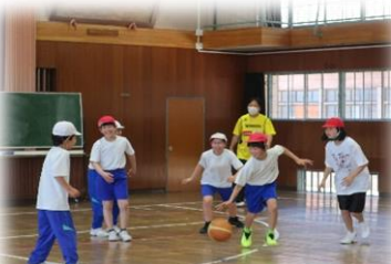
バスケットボール