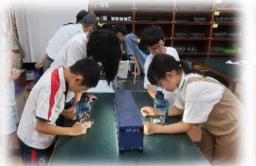
地層・化石・鉱物