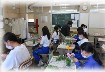
フラワーアレンジメント