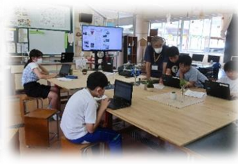
コンピュータで作っちゃお