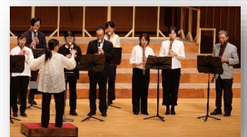
北小応援団/コーダー部

10月26日(木)音楽会 サントミュージゼでの音楽会。歌うこと、演奏することを楽しみ、一人一人が輝いていました！友だちと音を重ねる喜びも味わうことができました。そして、トリを飾った6年生は、歌詞に込められた熱い思いが伝わる合唱を披露しました。また、今年度は、北小応援団の皆様にも素敵なリコーダーの演奏していただきました。