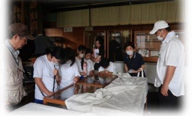
ふるさとたんけん