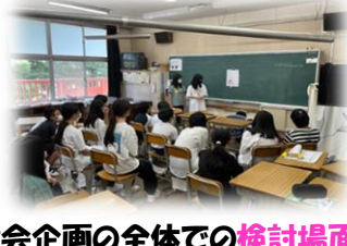
児童会企画の全体での 検討場面