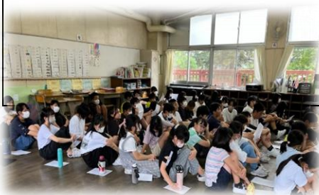
学年集会での 問題共有と話し合い