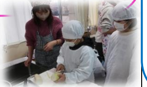
保護者の方も一緒に 活動する

生活科・総合的な学習の時間において ひと・もの・場所とよくかかわり 生まれる「こと」での表現・エネルギーの高まりを →教科の学習へとつなげていく。 →自分のことばで表現していく。