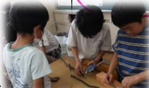
友だちとの かかわり