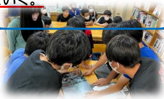
ピアリバトルでの 表現活動