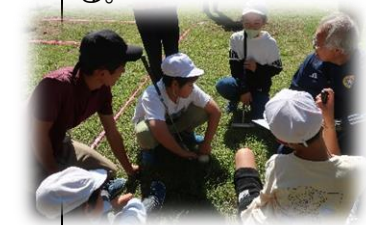
地域の方も一緒に 考え・楽しむ