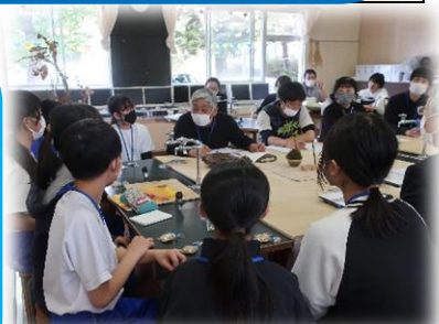
児童参加の 学校運営委員会