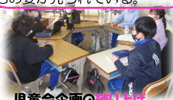
児童会企画の 練り上げ