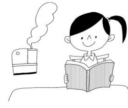
か か しつ しつ を を す す る