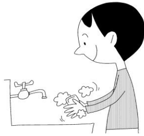
こまめに て 手を洗う