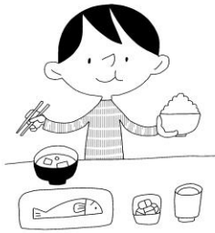
えいよう 栄養 しよくじ バランスのよい しよくじ 食事