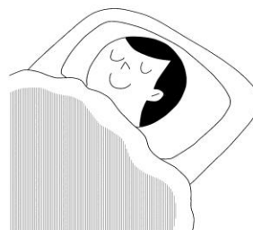
しっか し り り すい すい みん みん をと と る