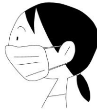
マスクを ちやくよう 着用する