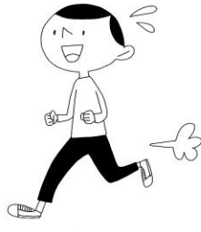
まいにち まいにち ちうんどう ちうんどう 毎日 ちうんどう 運動 ちうんどう をする