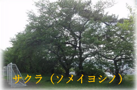
サクラ(ソメイヨシノ)

緑(みどり)は、自然を思わせる色です。森林や植物、芝生からイメージされるような穏やかさ、安らぎ、生命力などが感じられます。心を落ち着けることができます。北小の緑(みどり)を見つけてみましょう！