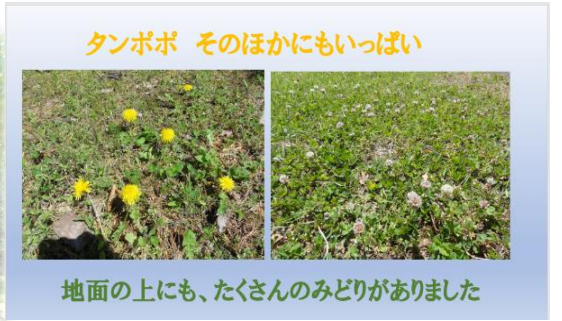
タンポポ そのほかにもいっぱい