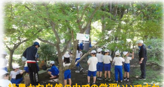
緑豊かな自然の中での学習いいですね。