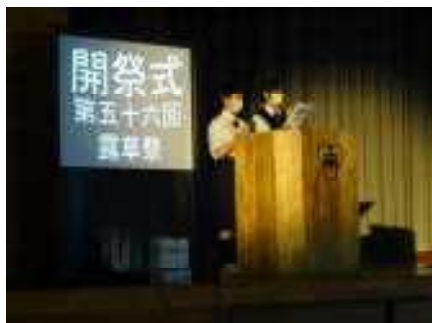
開祭式で役員の名司会