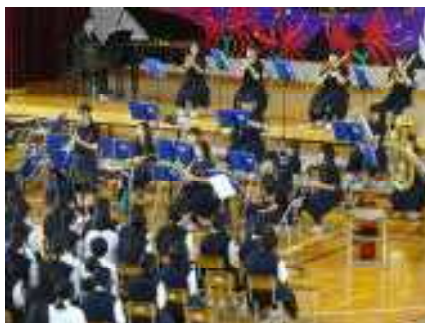
吹奏楽部発表 3年引退ステージ