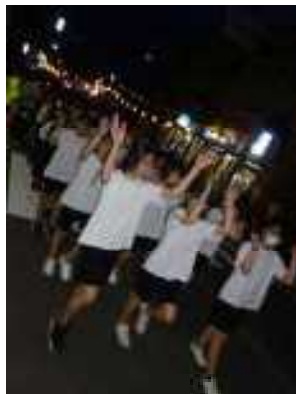
8/5 丸子ドドンコ参加の様子