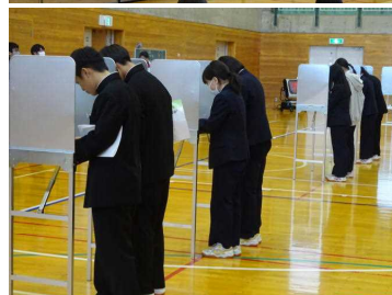
11/30 生徒会選挙の様子