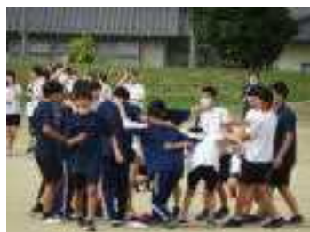
露草戦で一致団結！