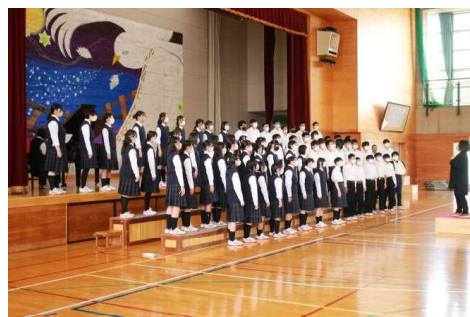
音楽会3学年合唱 思いを込めて