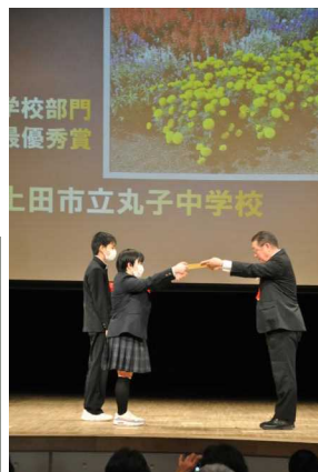
11/23花と緑のまちづくりコンクール表彰式