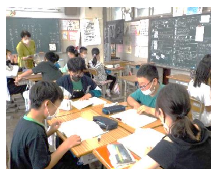
受容的な学習環境（肯定的支援）