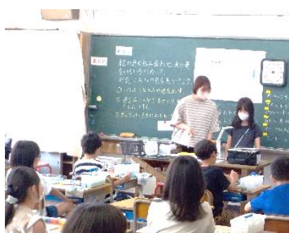
分かりやすい板書（視覚的支援）