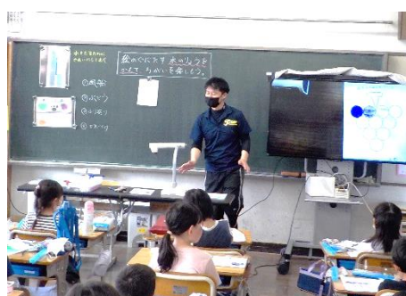
効果的な資料提示（具体的支援）