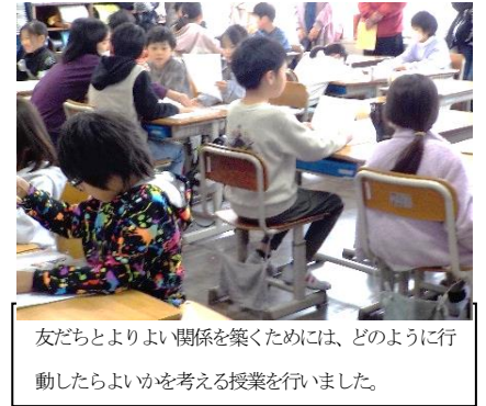
友だちのよいところを認め、ほめる「花さき山」の活動。素敵なメッセージの花が、たくさん咲きました。