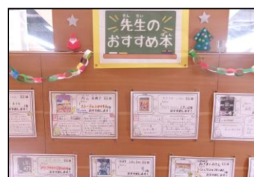
先生のおすすめの本コーナー