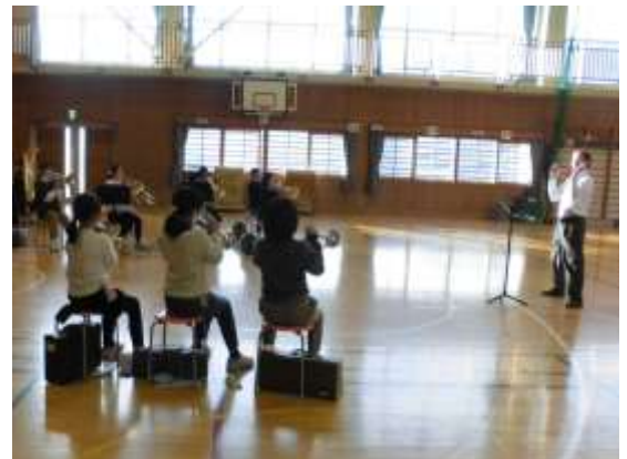
上田市民吹奏楽団の方の講習(12/10)