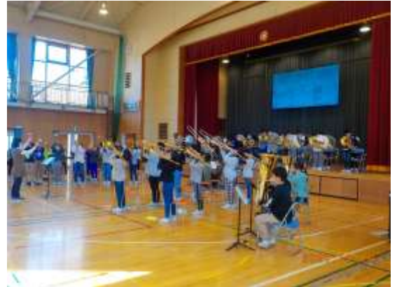
ありがとうコンサート(11/10)

12月10日(金)には上田市民吹奏楽団の方を講師としてお迎えして講習会を行いました。演奏を聴いてもらうと「元気に楽しく吹けていていいですね!」とほめてもらい、子ども達もニコニコ。これから寒い毎日ですが、練習への意欲が高まりました。