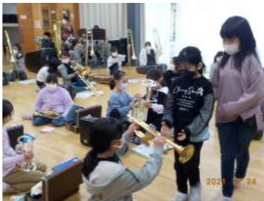
新体制での活動がスタート!