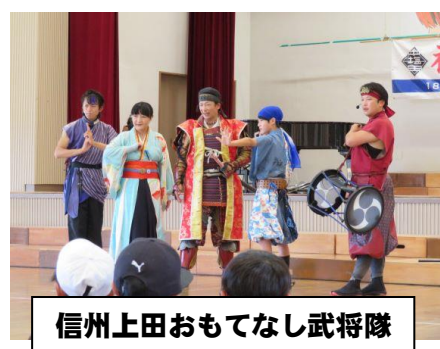
信州上田おもてなし武将隊