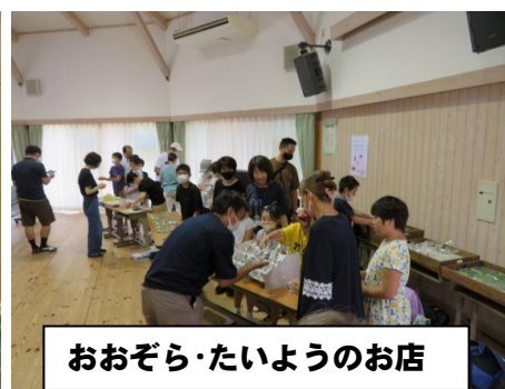
おおぞら・たいようのお店