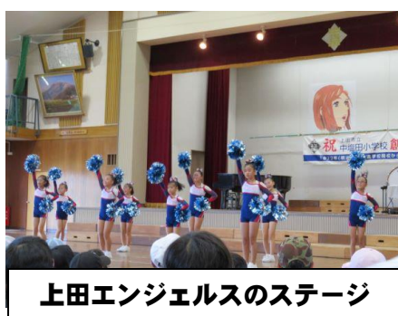
上田エンジェルのステージ