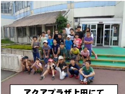
アクアプラザ上田にて

9月21日(木)、おおぞら・たいよう学級の皆さんが校外学習に行ってきました。学校をバスで出発し、アクアプラザ上田に到着。水着に着替えて波のプールへ GO!深いところまでチャレンジする子、波打ち際で水の動きを楽しむ子様々でした。プールの波が収まると、希望した児童がウォーターライダーや大きな浮き輪に乗っての溪流下りを楽しみました。こちらは身長制限があり、あと少しでできなかった子もいましたが、その子たちも「来年こそは!」と意気込んでいました。そしてプールの最後は、なぜかほとんどの子がお風呂へ。「いい湯だなあ。」と入る姿がほほえましかったです。