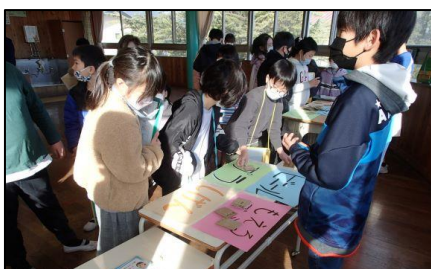
環境委員 分別競チャレンジ