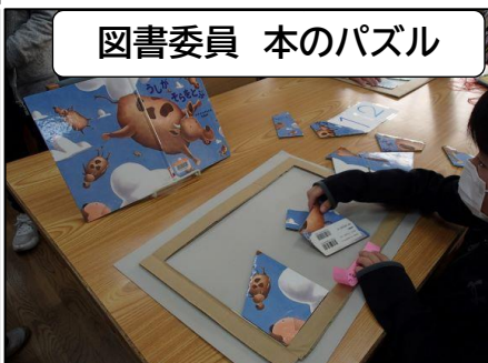
図書委員 本のパズル