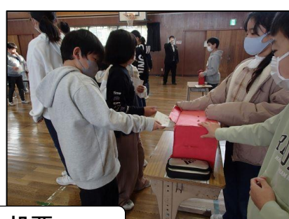
緊張の中、選挙管理委員による投票説明と投票