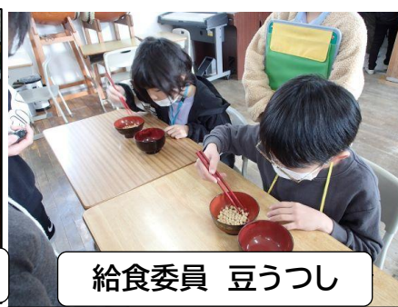
給食委員 豆うつし