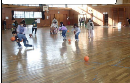
運動委員 ボール片付け