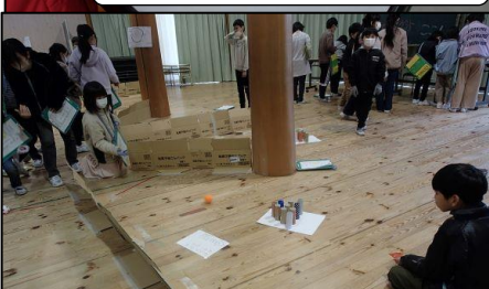
保健委員会 トイレトペーパーのボウリング