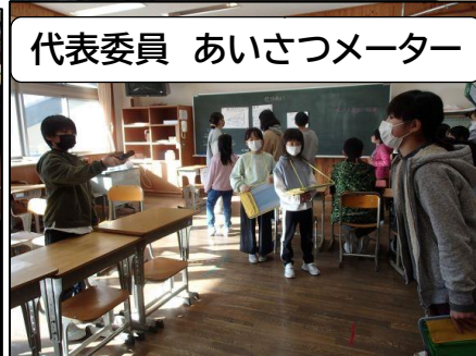
代表委員 あいさつメーター