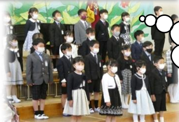
大きな声で、ドキドキの1年生、歌いました。