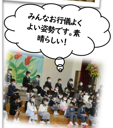
みんなお行儀よくよい姿勢です。素晴らしい!