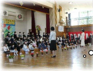
担任の先生の発表