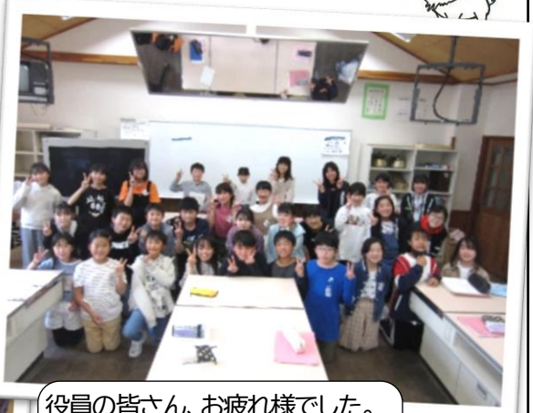
役員の皆さん、お疲れ様でした。今年1年、よろしくお願ひします。ファイティン！