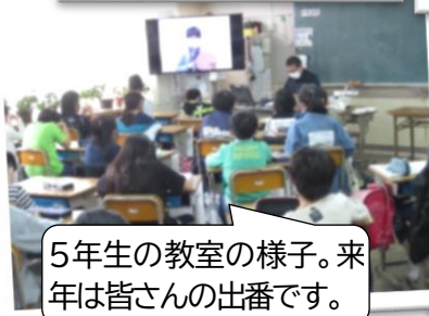
5年生の教室の様子。来年は皆さんの出番です。