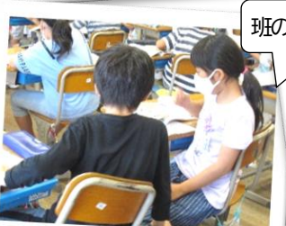
班の友と意見交換