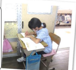
ふり返りはタブレットに入力