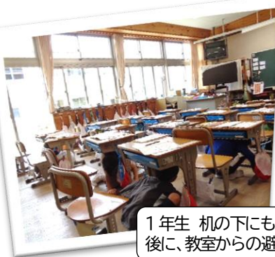
1年生 机の下にもぐった後に、教室からの避難

9月6日(月)の2時間目に、地震を想定した避難訓練を行いました。ここ数年、全国各地で大きな地震が起きていますが、ここ数年で一番大きな地震は、5年生が生まれた頃の平成23年3月11日に発生した東日本大震災です。多くの皆さんが、テレビ等で地震や津波による被害の映像や写真を見て、知っていることでしょう。この長野県は、津波の心配はありませんが、今回は、地震による家屋倒壊の危険があるので、すぐに安全な場所へ避難できるようにするための訓練でした。いつも生活している教室ではなく、特別教室からの避難ですので、当然、避難経路も変わります。実際に特別教室へ行き、避難経路の確認をしました。コロナ感染レベル5の影響を受け、残念ながら、全校で一斉に校庭への避難は行いませんでしたが、先生の指示に従って、机の下にもぐったり、頭を守るための行動をとったりした後に、素早く整列する練習をしました。