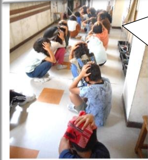
4年生 理科室 廊下で整列中も、頭をしっかりと守ります。