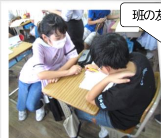
班の友と意見交換