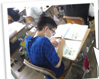
主人公の 思いの変 化の要因 を、自分 なりに考 えて記述 します。