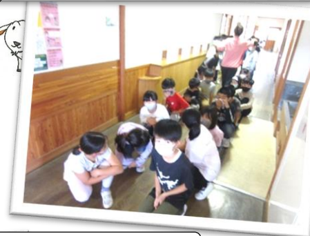
4年 視聴覚室 実際に歩いて、避難経路を確認