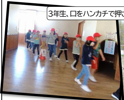
3年生、口をハンカチで押さえて、素早く避難です。