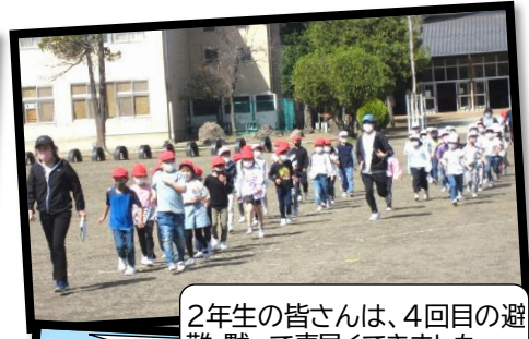
2年生の皆さんは、4回目の避難。黙って素早くできました。