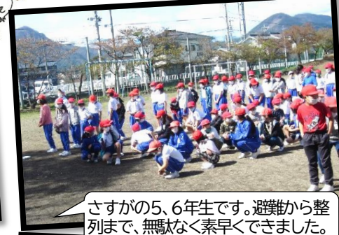
さすがの5、6年生です。避難から整列まで、無駄なく素早くできました。