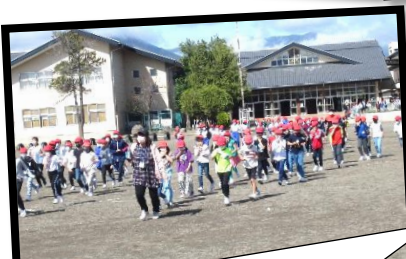
4年生、、、おしゃべりは一切なく、みんな無言で素早く避難できましたね。