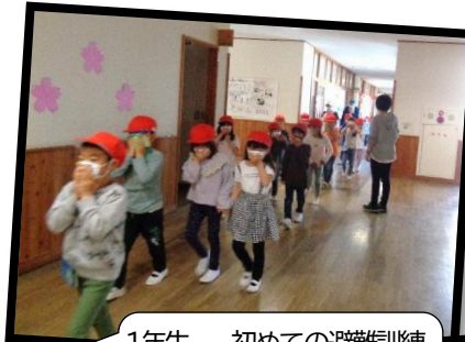
1年生、、、初めての避難訓練。先生の言うことをよく聞いて、できたかな？