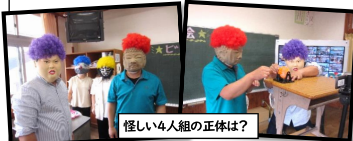
怪しい4人組の正体は？

9月17日（土）、PTA主催の盈進まつりを行いました。本来なら、土曜参観のあとに計画されていた盈進まつりですが、コロナの影響を受け、授業参観は中止に。そのような中、PTA役員の皆さんが、少しでも中塩田小のお友だちにお祭りを楽しんで欲しいと、現在の感染状況に応じた今できる内容を検討し、オンラインでのビンゴ大会を計画してくださいました。TV画面から、数字が発表される度に、自分のビンゴカードを見て、数字を探します。「リーチ！」「やったー、ビンゴだ！」教室から次々に聞こえてくる声。役員の皆さんが用意してくださったお菓子をいただきました。