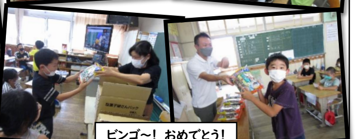
ビンゴ～！おめでとう！