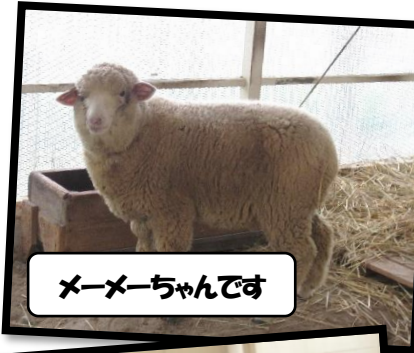
メーメーちゃんです