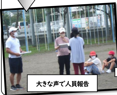
大きな声で人員報告