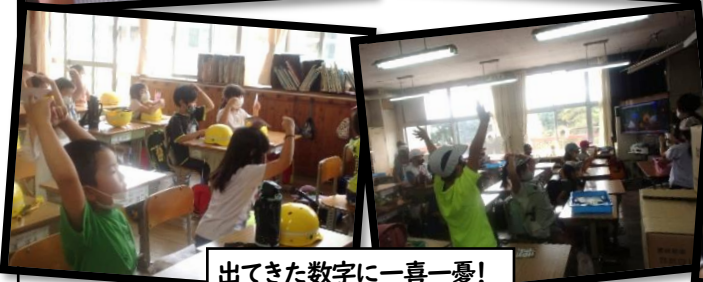
出てきた数字に一喜一憂！