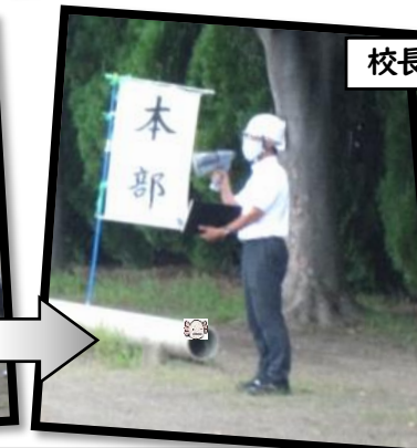
校長先生のお話を静かに聴く