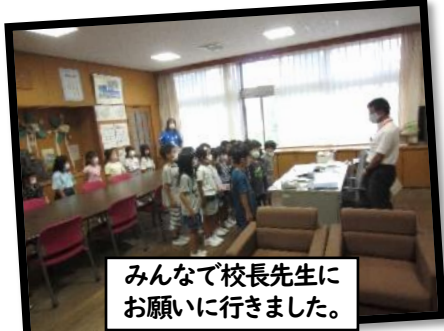
みんなで校長先生に お願いに行きました。

リッキーとお別れをして1年2ヶ月。9月8日（木）、中塩田小学校に新しいお友だちが増えました。羊の「メーメーちゃん」です。メーメーちゃんは、今年の3月に生まれたばかりの子羊です。これから1年2組のお友だちが、生活科の学習の一環として、毎日お世話をしていきます。