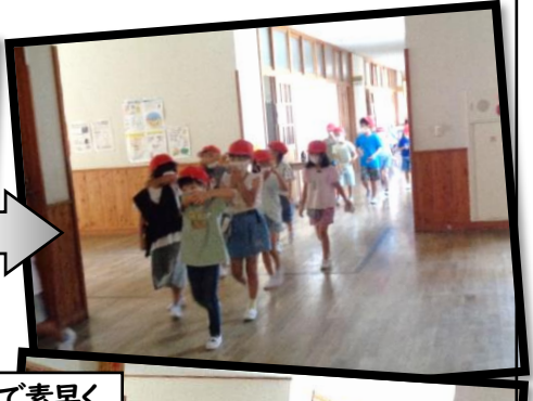
無言で素早く 避難する