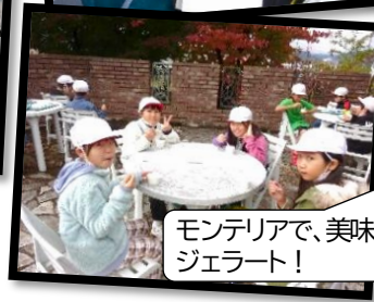
モンテリアで、美味しいジェラート!