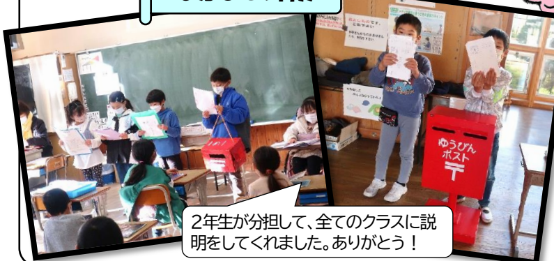
2年生が分担して、全てのクラスに説明してくれました。ありがとう!