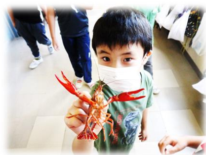
ザリガニを飼っています（1年生）