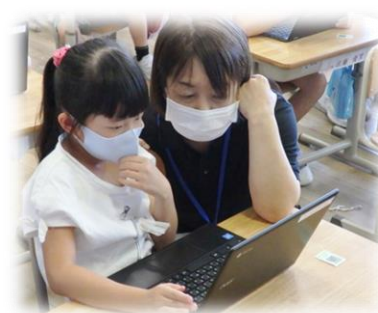
タブレットを使った学習