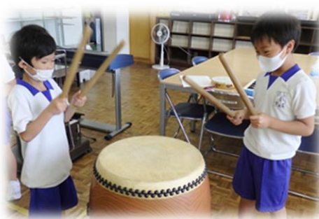
西小わくわくコンサートの練習