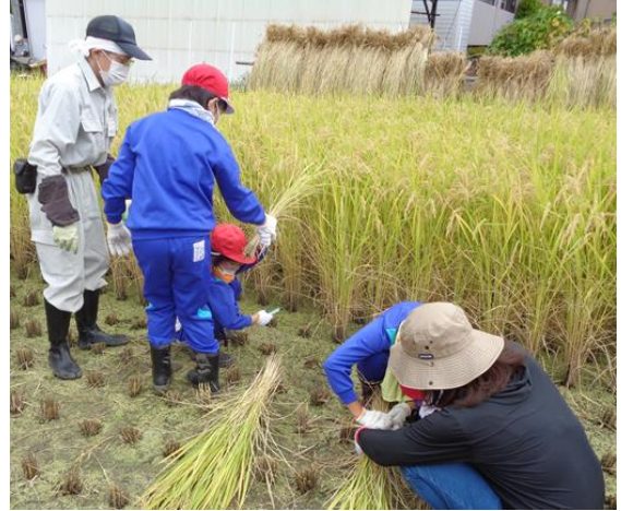
貴重な体験ができました

西部米づくり実行委員会の皆さん、ボランティアの皆さんありがとうございました。皆さんのご協力のおかげで、貴重な体験ができました。10月の脱穀でもお世話になります。