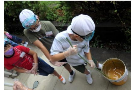
廃油石鹸づくり（4年生）