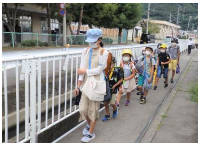
登校班による朝の集団登校