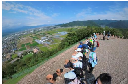
森将軍塚古墳見学（6年生）