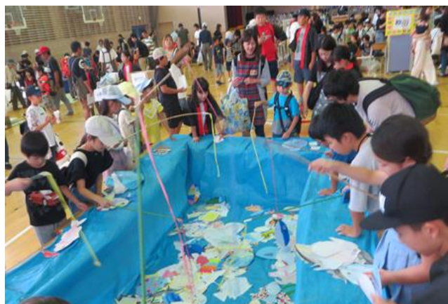
前回(令和元年)の元気市の様子

「西小元気市」では例年と同様にバザーを開催します。例年ですと地域の皆様に出品を依頼しますが、今回はPTA会員の皆様に出品へのご協力をお願いします。子どもたちが楽しめる企画も考えています。景品を用意したいと考えていますので、こちらの出品にもご協力ください。詳しくは、学校からオクレンジャーでお送りした通知をご覧ください。