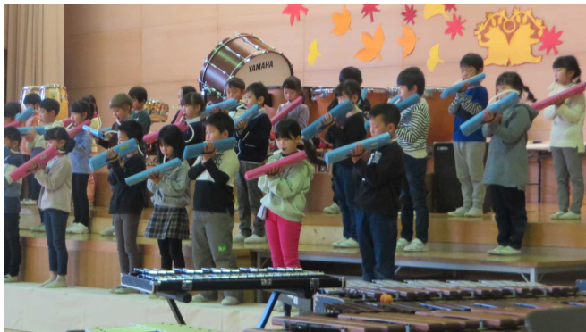
みんなの音がそろい演奏する楽しさが伝わった1年生