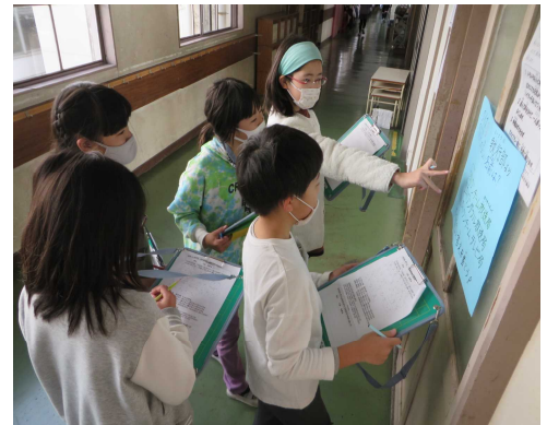
ペアの4年生と相談する3年生

11月26日に児童会主催のなかよしタイムが開かれました。いじわる星人から西小を守るために、なかよし学級のペアでクイズを解き、ガンバレンジャーを助ける合言葉を手に入れなければなりません。高学年の児童が、下級生をやさしくリードしながらクイズを解いて回りました。クイズは各委員会に関する内容でしたが、難しい問題もあり「これが正解かな？」と頭を悩ませていました。閉会式では、ビデオでしか見たことがなかったガンバレンジャーが、初めてステージに登場し、大いに盛り上がりました。全校で合言葉を元気よく唱えると、ガンバレンジャーが復活し、西小を守ることができました。