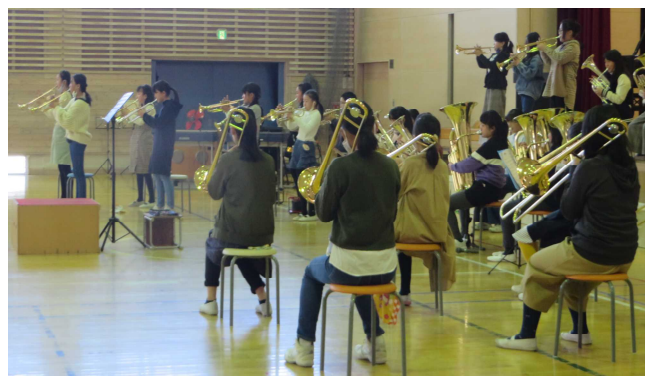
明るい音色を響かせ 感動を与えてくれた金管クラブ