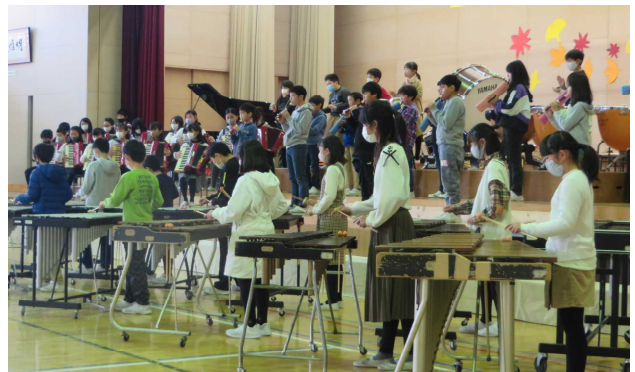
打楽器のリズムと音の重なりでダイナミックに表現した5年生