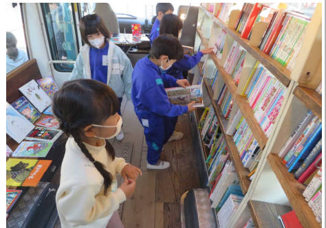
ワクワクしながら本を選ぶ

2年生以上は昨年度までに経験しているので、気に入った本をすばやく見つけ、さっそく読んでいました。今回の寄贈により、各教室の学級文庫に魅力のある本が、たくさん入りました。これを機会に、本と向き合う時間が増え、読書への関心が高まることを願っています。