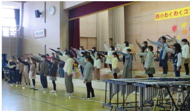
オープニングでやわらかな響きを届けてくれた合唱隊