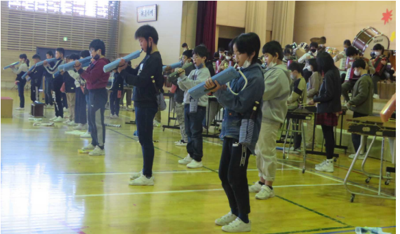
厚みのある響きと迫力いっぱいの演奏で下級生があこがれる演奏になった6年生

保護者の皆様には、感染防止のための人数制限、入替制、消毒、受付係等にご協力いただきありがとうございました。温かな拍手が子ども達の励みになりました。