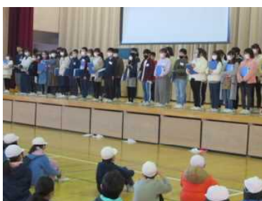
やる気に満ちた5年生の新役員

今年度、築いてくれた新たな伝統を5年生が受け継ぎ、さらに笑顔のあふれる西小になることを願っています。