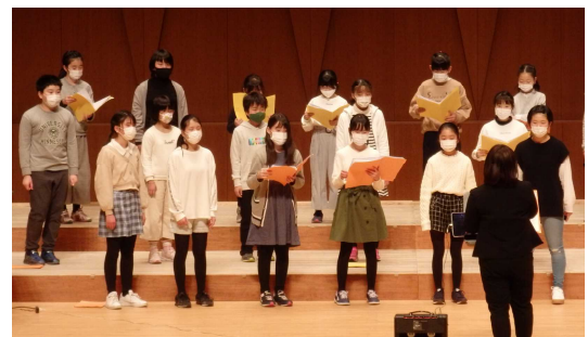
澄んだ歌声をホールいっぱいに響かせる

そのような中、2月6日にセントミュージーズでのコンサートを開催できることになりました。6年生を中心に子ども達は「今までの感謝、そして自分たちの成長を伝えたい」「聞いている人も演奏する人も楽しめる、盛り上がるコンサートにしたい」と考え、主体的にコンサートの企画運営に取り組みました。