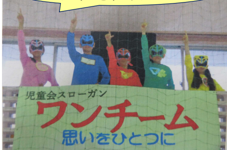
盛り上げてくれたガンバレんジャー

2つめのピンチは、児童会のなかよし学級の交流です。感染防止のため、手をつなぎ大きな声を出すことができませんでした。そこで西小アドベンチャーは、マスクと手袋をしてなかよし学年で楽しみました。協力しながらミッションをクリアすることで、みんなの笑顔が広がりました。また、なかよしタイムでは、全校が楽しめるように6年生が工夫してくれました。ガンバレんジャーが登場し、会場を盛り上げてくれました。(中略)