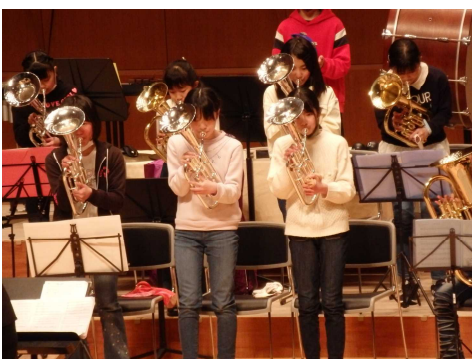
心を合わせて気持ちよく演奏

ところが、1月中旬に上田市の感染警戒レベルが4になり、部活動が中止となってしまいました。それでも、あきらめずに個人練習を続け、開催できることを祈っていました。ようやく2月に部活動が再開され、2週間の遅れを取り戻そうと集中して頑張りました。